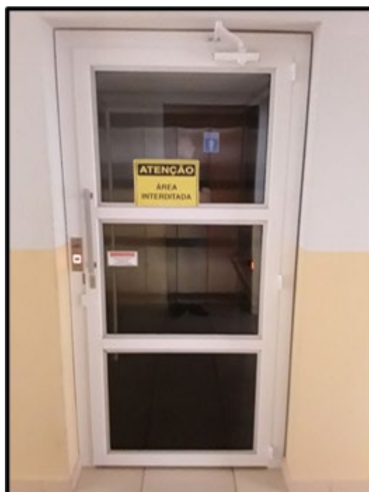
Foto: Acessibilidade do polo.