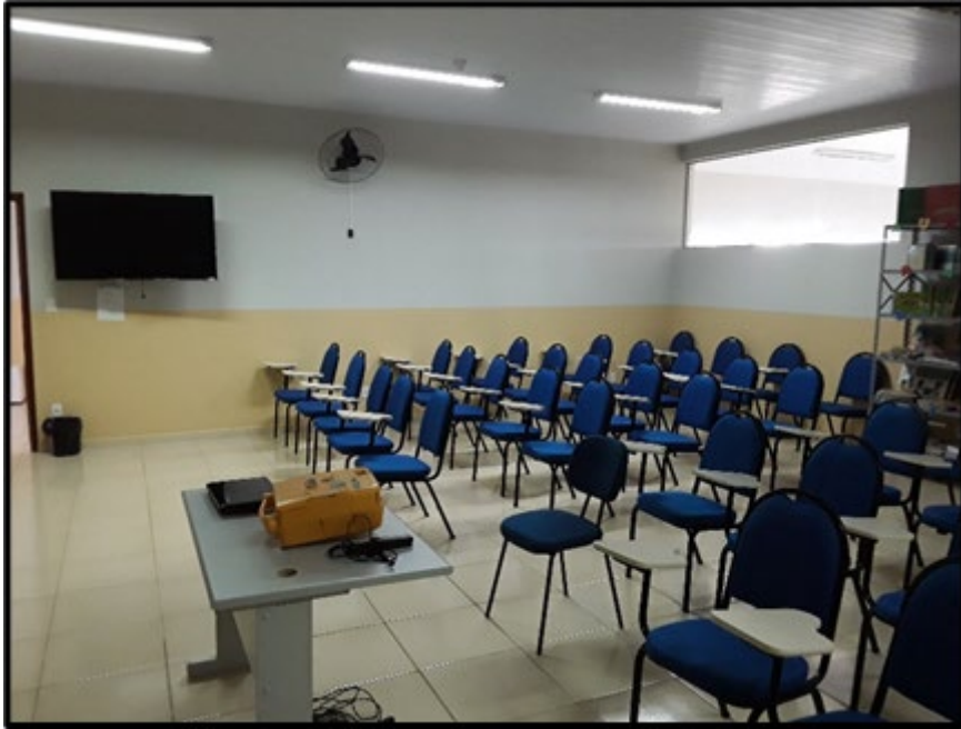
Foto: Laboratório de Informática FOTO DIURNA – ênfase na iluminação.