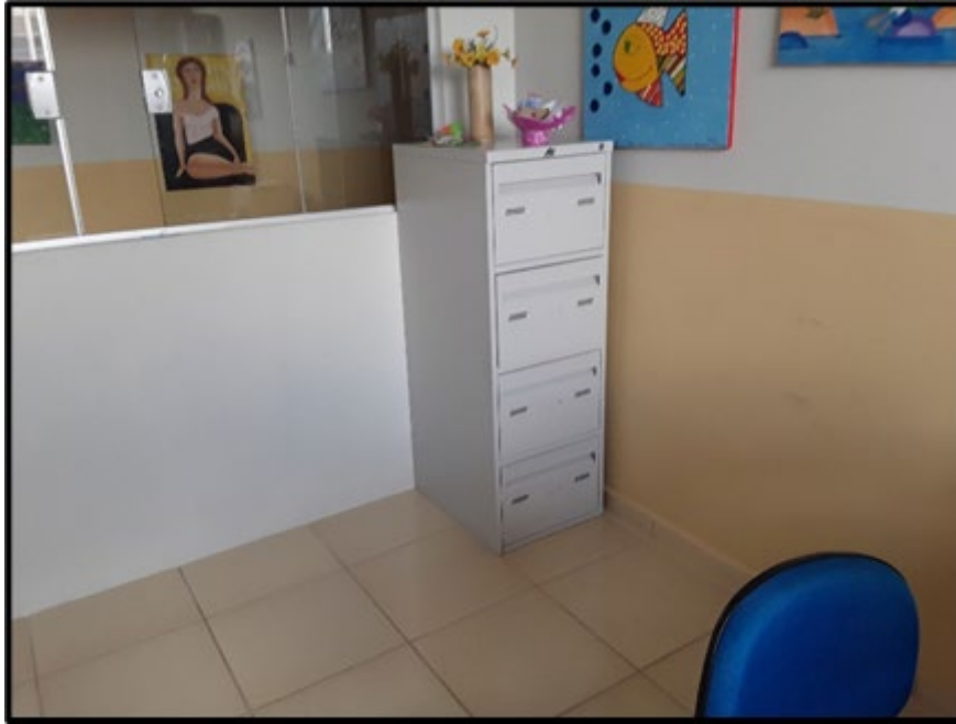
Foto: Sala de aula.