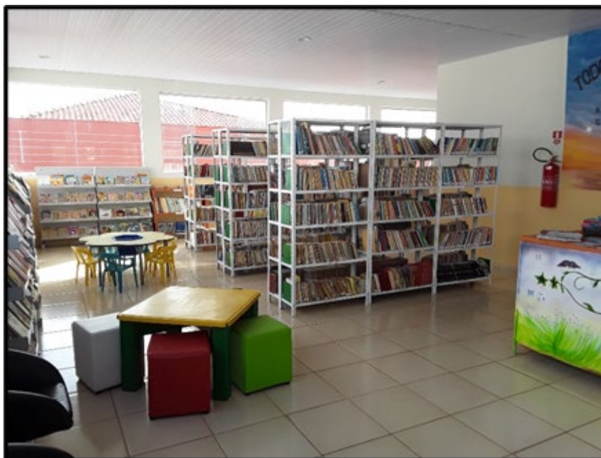
Foto Sala de tutoria.