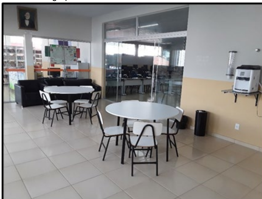
Foto: Espaço da Biblioteca/Brinquedoteca/Laboratório.