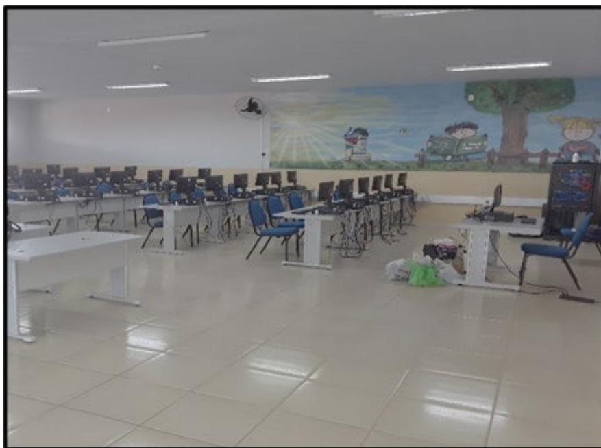
Foto: Sala de estudo em grupo.