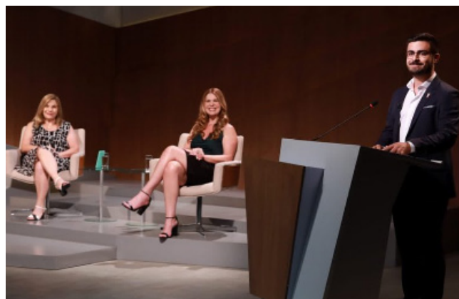
Imagem: Nadja Kouchi